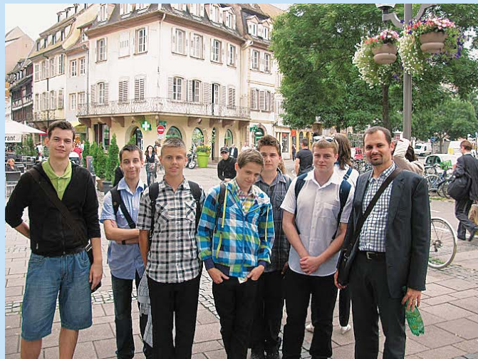
Žiaci Základnej školy Alberta Molnára Szencziho v Strasburgu v Európskom parlamente. / A Szenczi Molnár Albert Alapiskola diákjai Strasbourban.