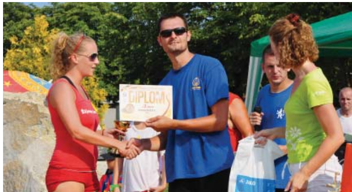
Družstvo seneckých Kanonierok skončilo druhé.

stvá, z čoho až tri poskladali hádzanáčky Piccardu Senec. Ani jedno z nich však nestačilo na víťazky Turenskej ženskej miniligy - Rebelles, ktoré aj na piesku dokázali svoju nespornú kvalitu.