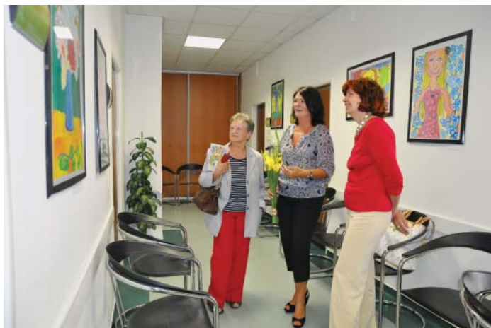
Výtvarné práce detí priestory centra oživil.