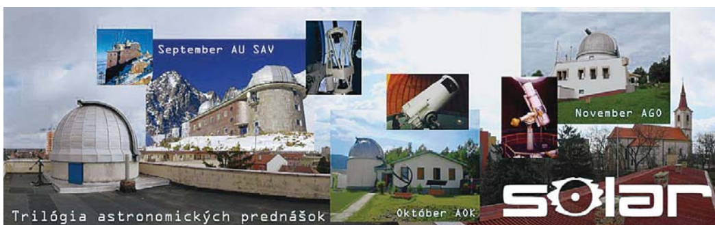
Trilógia astronomických prednášok